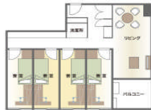
ユニットイメージ (個室4室・共用リビングで構成)

住み込みのハウスマスター(管理人)夫妻や24時間常駐の警備員、大学が選抜・研修した先輩寮生であるRA(レジデント・アシスタント)が、安心して快適な寮生活をサポートします。