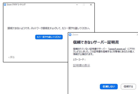
※学内ネットワーク認証を行わなかった際の Zoom のエラー画面

常設 PC、もしくは持込 PC 使用時、学内ネットワーク認証を行う前に Zoom 等の配信アプリケーションを開かれた場合、エラーメッセージが表示されてしまいます。※右図は Zoom 起動時の画面下記の手順をご参考にしていただき、学内ネットワーク認証を行ったうえでアプリケーションの起動をお願いいたします。