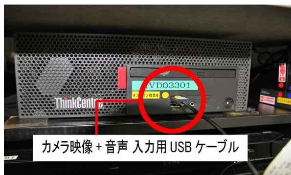
カメラ映像 + 音声 入力用 USB ケーブル

A. 配信用 PC に『カメラ映像 + 音声 入力用 USB ケーブル』は挿さっておりますでしょうか。写真の USB ケーブルを配信用 PC に挿すことで、教室の WEB カメラと教室に拡声されている音声 が PC に認識されます。この USB ケーブルは、常設 PC に限らず 持込 PC でも同様にご利用いただけます。