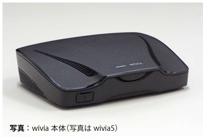
写真：wivia 本体(写真は wivia5)

wivia(ワイビア)は専用アプリ(ソフトウェア)のインストールで設置教室にてワイヤレス投影が可能です。接続には学内ネットワークの無線 LAN を利用します(Waseda ID 等の情報が必要です)。