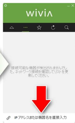
【PC側】ソフトウェアを起動し

「Name」または「IP」に表示されている文字列を入力 パスワードは「Code」に表示されている文字列を入力