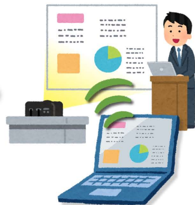
PC画面と同じ画面を教室 AV システムで投影

「Name」または「IP」に表示されている文字列を入力 パスワードは「Code」に表示されている文字列を入力