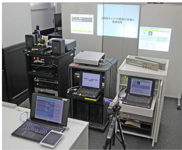
相談窓口を設置された機器類

早稲田ポータルオフィスでは教室 AV 機器利用時のトラブル対策の一つとして授業期間前に「AV 機器講習会」を実施しておりました。