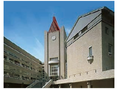
中央図書館(早稲田キャンパス18号館)

早稲田大学図書館は、東京専門学校(1882年)以来の長い歴史を持ち、蔵書数は約580万冊と、国内の大学のなかでも有数の規模を誇る図書館です。