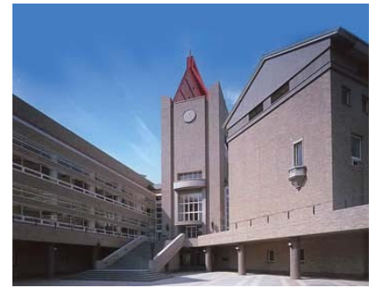
中央図書館（早稲田キャンパス18号館）

学内には中央図書館をはじめ、4つのキャンパス図書館（高田早苗記念研究図書館、戸山図書館、理工学図書館、所沢図書館）や、学生読書室、教員図書室など、20をこえる図書館・図書室があり、これらを総称して「早稲田大学図書館」と呼んでいます。