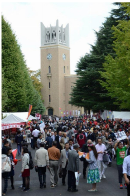
▲早稲田大学の公式TwitterにてT.M.を発見。右側の目立っ。これ私です。(笑)

WISHでは、今年も稲門祭にてはし巻きを販売しました。「はし巻きって何？」という方も多いと思います。(実際、販売しているときにもみなさんに何回も聞かれました(笑)) はし巻きとは、お好み焼きを食べやすいように箸で巻いたものです。関西の方では有名な粉食です。