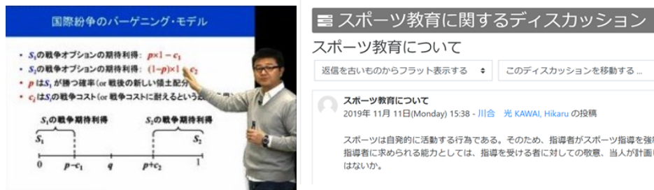
オンデマンド授業コンテンツの 受講イメージ

あらかじめ収録された講義映像と電子教材を組み合わせた講義コンテンツをインターネットで配信することにより、受講生が自分のスケジュールに合わせて学習することができる授業形態です。