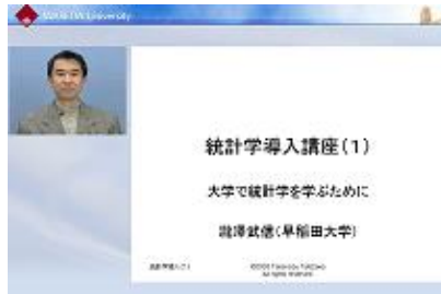
オンデマンド授業コンテンツの 受講イメージ

あらかじめ収録された講義映像と電子教材を組み合わせた講義コンテンツをインターネットで配信することにより、受講生が自分のスケジュールに合わせて学習することができる授業形態です。