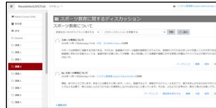
BBS（電子掲示板）による 教員・学生のコミュニケーション