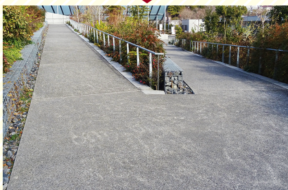
戸山の丘のスロープ Slope on Toyama Hill

This area includes a gentle slope and two flat spaces.