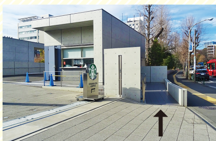
守衛室の脇のスロープ A slope located along the Campus Security Office