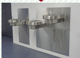
水飲み場 Water fountains

Water fountains are installed at these heights for the convenience of wheelchair users.