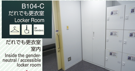
B104-C だれでも更衣室 Locker Room