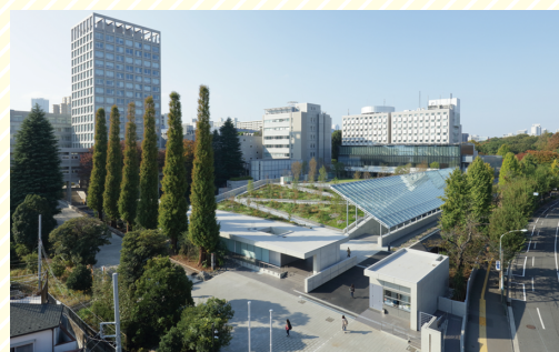
アリーナ全景 Overhead view of the arena

Inside the facility, various measures are taken to accommodate those with special needs. Several of these accommodations are introduced below.