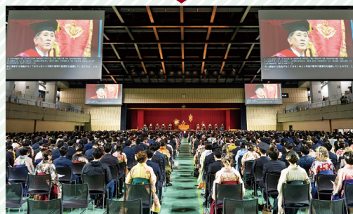
メインアリーナでの卒業式風景 Scene of commencement at the main arena

A translated text is projected along with the projection on four giant screens at commencement and entrance ceremonies.