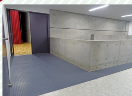
ステージ入口 Stage entrance