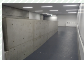
ステージへのスロープ Slope to the stage

The steps up to the stage have been replaced with a slope.