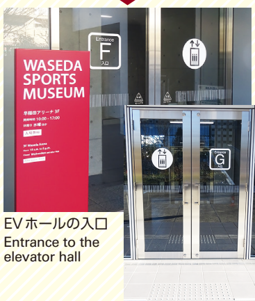
EVホールの入口 Entrance to the elevator hall

The arena has elevators in two different locations.