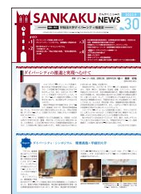
さんかくニュース Sankaku News

だれでもトイレサイン Symbol for Gender-neutral/ accessible restroom