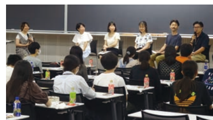
Rikohティータイムシンポジウムの様子 Teatime symposium for those with science background

Carrying out Questionnaires on Awareness and Status of Equality and Diversity Promotion at Waseda University (for faculty and staff)