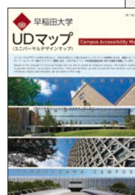
早稲田大学UDマップ WASEDA University Accessibility Map