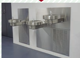
水飲み場 Water fountains

Water fountains are installed at these heights for the convenience of wheelchair users.