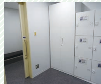
だれでも更衣室室内 Inside the gender-neutral / accessible locker room