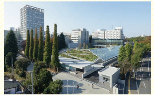
早稲田アリーナ全景 Overhead view of Waseda Arena

Inside the facility, various measures are taken to accommodate those with special needs. Several of these accommodations are introduced below.