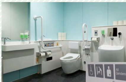
だれでもトイレ室内 Inside the gender-neutral / accessible restroom