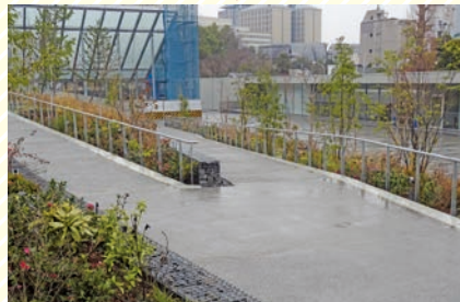
戸山の丘のスロープ Slope on Toyama Hill

This area includes a gentle slope and two flat spaces.