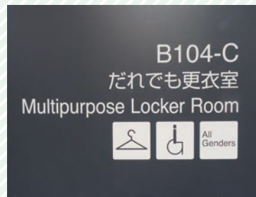
だれでも更衣室のピクトグラム Pictograms outside the gender-neutral / accessible locker room