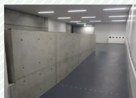
ステージへのスロープ Slope to the stage

The steps up to the stage have been replaced with a slope.