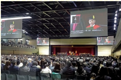
メインアリーナでの卒業式風景 Scene of commencement at the main arena

A translated text is projected along with the projection on four giant screens at commencement and entrance ceremonies.