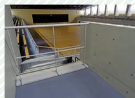
地下1階客席の車いす専用スペース Wheelchair space for the first-floor basement audience seating

Wheelchair spaces have been established in a total of four locations.