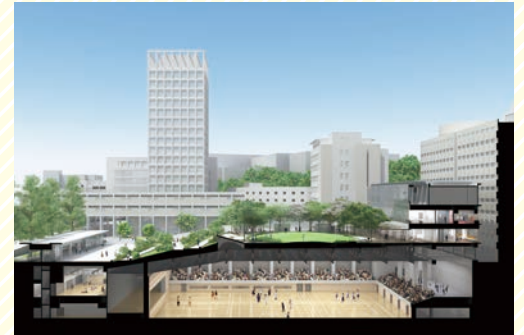
早稲田アリーナ断面図 Cross-section view of Waseda Arena