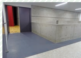
ステージ入口 Stage entrance