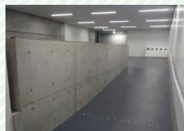
ステージへのスロープ Slope to the stage

The steps up to the stage have been replaced with a slope.