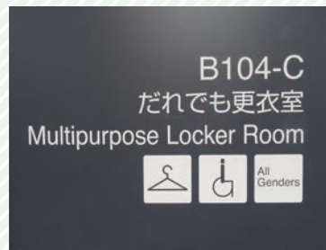
だれでも更衣室のピクトグラム Pictograms outside the gender-neutral / accessible locker room