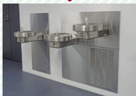
水飲み場 Water fountains

Water fountains are installed at these heights for the convenience of wheelchair users.