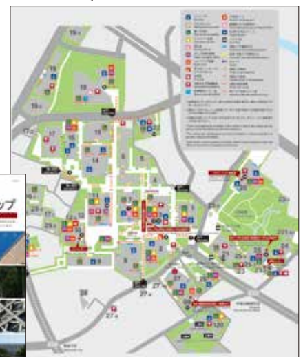
早稲田大学UDマップ掲載の早稲田キャンパス WASEDA University Accessibility Map: WASEDA Campus