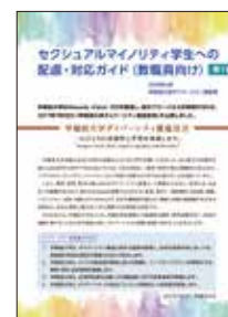
セクシュアルマイノリティ学生への配慮・対応ガイド (教職員向け) "Guide to Consideration and Treatment of Sexual Minority Students" for faculty and staff