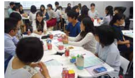
Rikohティータイムシンポジウムの様子 Teatime symposium for those with science background