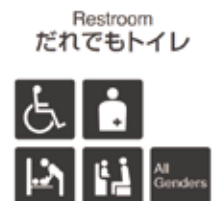
だれでもトイレサイン Symbol for multipurpose restroom