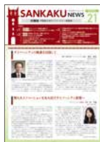
さんかくニュース Sankaku News