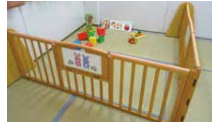
学生・教職員用託児室 Nursery Center for Students and Faculty