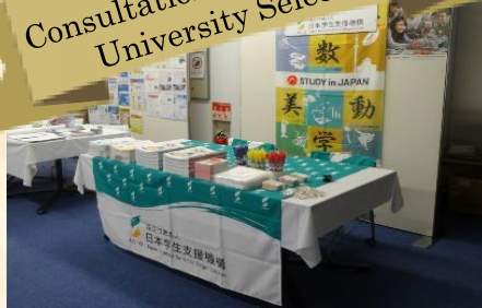
奨学金・進学相談 Consultation on Scholarship/ University Selection