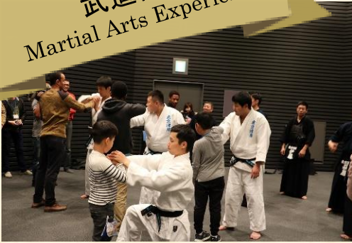
武道体験 Martial Arts Experience