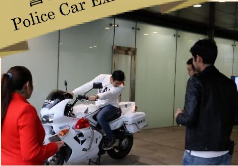
警察車両展示 Police Car Exhibition