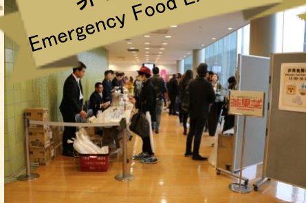
非常食展示 Emergency Food Exhibition