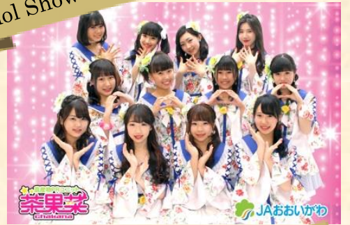
農産物 PRユニット「茶果菜」 Idol Show by "Chakana"