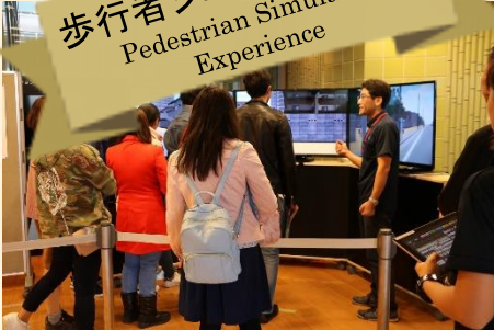
歩行者シミュレータ体験 Pedestrian Simulator Experience