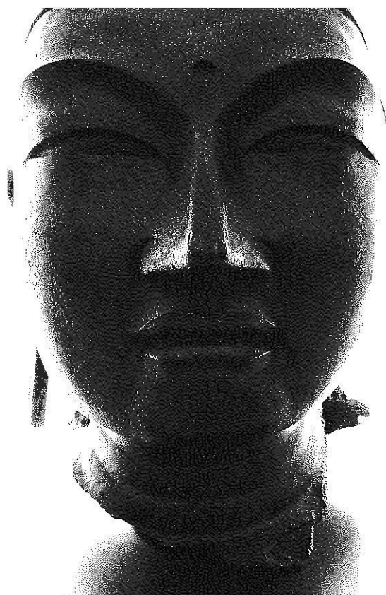
図1 ※写真はレプリカ

図1は、いくたびもの変転を経て現代まで伝えられた白鳳仏である。天武天皇の685年に開眼供養されたこの薬師如来像は、はじめ E に安置されていたが、1187年に F へ移され、東金堂の本尊とされた。その後、1411年の火災に遭って損傷し、頭部のみが残されたのである。東金堂の再建後、この残骸は新しい本尊の台座の中へ収納された。それから500年が過ぎ、だれも仏頭の存在を知る人がいなくなった1937年、台座の解体作業中に偶然発見されたのであった。長く数奇な運命をたどった仏頭の眼差しは、文化遺産を未来に継承していくことの意味について、無言のままわたしたちに問いかけている。