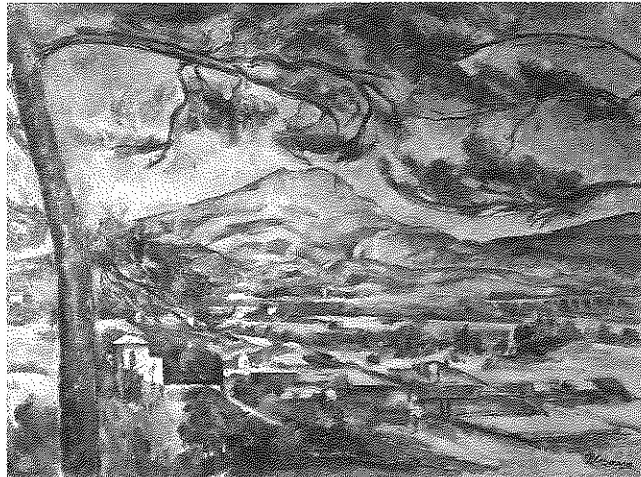
図3 《サント=ヴィクトワール山》1887年頃 ロンドン、コートールド・ギャラリー