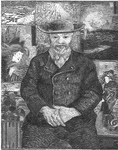
図1 《タンギー爺さん》1887年 パリ、ロダン美術館

19世紀後半から20世紀初頭にかけて、ヨーロッパ絵画の行き詰まりを打開するために、フランスを中心とした多くの画家が、日本美術の様式や技法を参考にした。この動向をジャポニスムと呼ぶ。Aの《タンギー爺さん》(図1)の背景には、たかさんの浮世絵が飾られていて、日本美術の流行をうかがわせる。Bの《笛を吹く少年》(図2)の灰色無地の抽象的な背景も、浮世絵の役者絵を思わせる。Cが繰り返し故郷の「サント=ヴィクトワール山」(図3)を描いたのは、山を聖なるものとみなす葛飾北斎の富士山連作に速く影響されたものであろう。