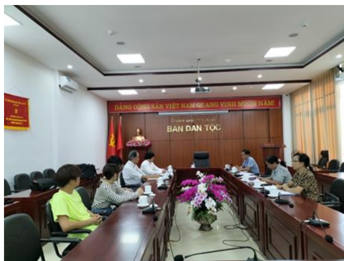
2022年: ベトナム・山岳少数民族の貧困に関する会議

その他、学生の要望に応じて、日本の現状を考えるために、東南アジアで学生交流を行う。また、海外とオンラインで合同発表会を実施する。