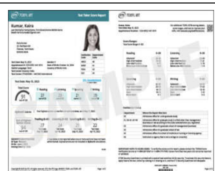
「2. Official Score Report の直送手配が完了していることがわかる画面」の例