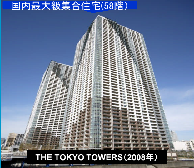
THE TOKYO TOWERS(2008年)