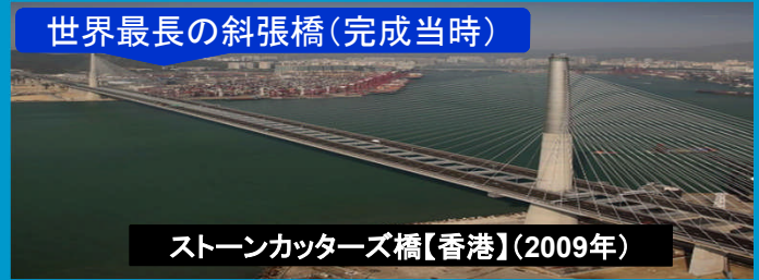
ストーンカッターズ橋【香港】(2009年)