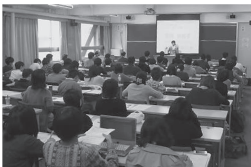
「教員就職指導会」の様子