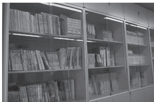
各種冊子閲覧コーナー