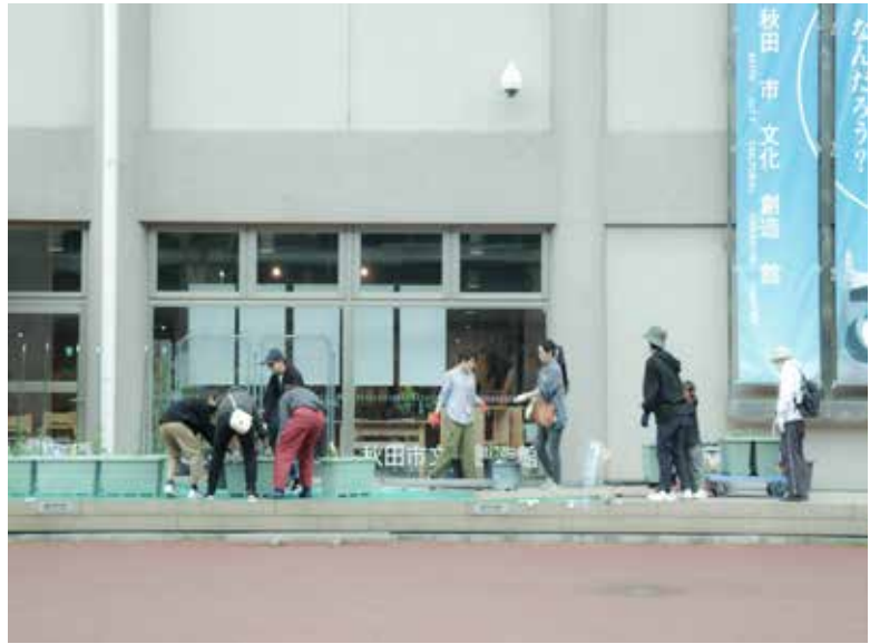
文化創造館で行う「おやさい隊」の様子

話に耳を傾けることで関わりが生まれ、その関わりから能動性が生まれていく。そして、能動性が企画を生み、いくつもの企画がまちの文化を生み出していく。あえて「鑑賞」ではなく「創造」にフォーカスをした文化創造館は、そうやって、まちの未来を作ろうとしているのです。