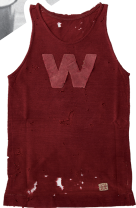
朝倉充(1936年専門部商科卒 第14~17回大会出場) 着用ユニフォーム