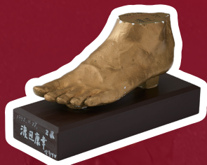
渡辺康幸 (1996年人間科学部卒 第69~72回大会出場) 足形石膏 1992年