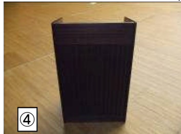
★司会台 45X65X106 1台