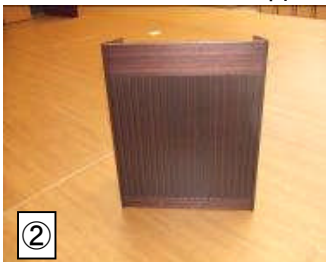
★講演台 45X90X106 1台