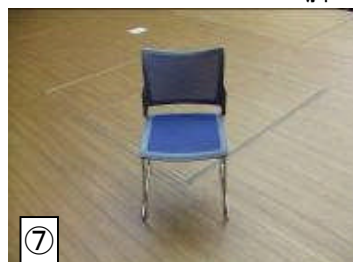
★椅子(LUFT チェア) 20脚