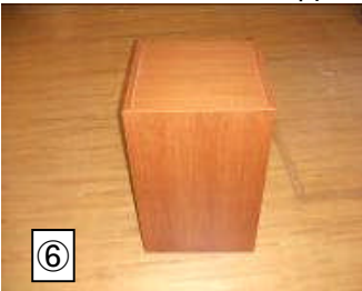
★花台 47X47X70 1台