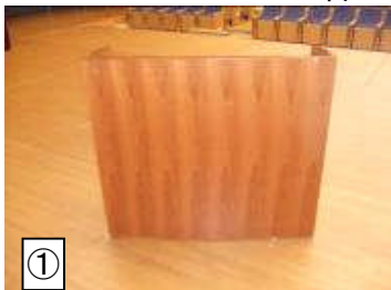
★講演台 47X120X104 1台