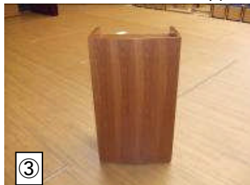
★司会台 47X60X104 1台