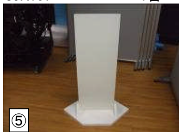
★舞台めくり 39X107 1台