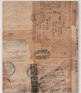
杉原発給の日本通過ビザ