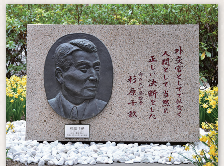
早稲田大学早稲田キャンパス14号館横の記念レリーフ