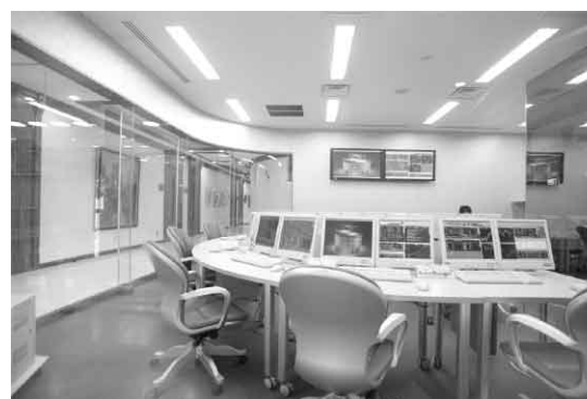
サイバー・トレーディング・ルーム