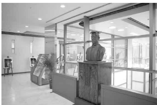
日本橋キャンパスエントランス