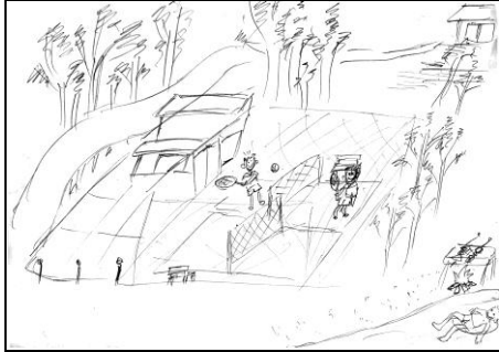
図1.自分のまちの好きなところ(常陸太田住民A)

市、国府町ともに住んでいるまちの好きな点には家の近くの田園風景を描いたものが多くみられ、嫌いな点は交通事情を描いたものが多かった。また、表1の描画分類カテゴリごとに描画を分類し、常陸太田市(好き)・常陸太田市(嫌い)・国府町(好き)・国府町(嫌い)ごとに集計した結果を表2に示した。