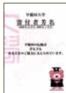
寄付者芳名(印刷用複製)

会員の皆様には「会員証」を発行するとともに、下記のサービスを提供させていただきます。