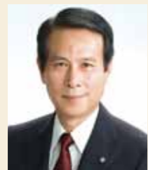
早稲田大学総長 鎌田 薫

つきましては卒業生、ご父母、教職員等の本学関係者はもとより、早稲田大学の校風を愛し、その教育・研究のさらなる発展にお力添えいただけるという皆様の、「WASEDAサポーターズ倶楽部」へのお申し込みを、心よりお待ちしております。