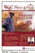
WSC News Letter

学校法人早稲田大学が行う各種事業への恒常的な財政的支援。本倶楽部への寄付金は、経費を除き「資金」として積み立てます。当面は資金の蓄積に専念しますが、具体的な支援事業は大学が厳正に審査・決定し、当該資金を充当させていただくことになります。お申し込み実績および支援事業選定、用途の詳細等については、年1回発行の「WSC News Letter」および専用Webサイト上で、寄付者の皆様にご報告いたします。