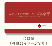
会員証(写真はイメージです)