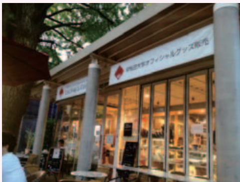
ちなみに今回の収録が行われた場所は大隈講堂すぐ脇にあるUni.shop&Cafe125です。とても居心地の良い空間で有意義な女子会を開催することができました～。

想像と違って、げんなりしちゃった。で、その人とは何事もなかったかのように帰国後もアルバイト先で顔を合わせてます。 三…その後は何もなかったの？ 宇…なかったー。仲良い人もいたけど、年上だったからお兄さんって感じだったな。 岡…ところでお二人は自分のことを話されないんですか？ 山・浅…うちらはフアンリテーターだから！(笑) 山…じゃあ：最後に言いたいことは？ 宇…夢を持って行こう！ 三…今は彼氏彼女がいらない人も、海外では何かあるかもしれないよ？ ってね。 外国人かっこいいよ(笑) 宇…でもあんまり期待しすぎると…。 三…だまされないようにはしないとね。 山…でも基本みんな紳士だよな？ 宇…確かにー。みんなドア開けて待っていてくれるもんね。逆に申し訳なくなっちゃう！ 山…みんな笑顔で待っていてくれるんだよ？ 宇…かっこいいよね。 三…外国人と付き合ってみたかったな。：ストリートに伝えてくれるののいいなって思った！ 宇…ねー！ でも、そういう面もあるからこそ日本人がいいなとも思ったかな。 山…相手のことを察してくれるよね！ 気遣いっていう面では日本人の方が良い部分あるかもね。：どっちにもメリットとデメリットがあるよね(笑) 浅…ではそろそろお時間がきてしまいましたが女子会お開きにしましょーう！ ありがとうございます！