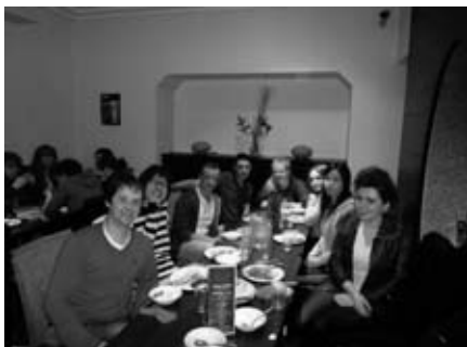
テニス部のチームメイトとの食事 遠征時の一枚

伊…実際、テニス部の人たちとは一緒にご飯を食べに行ったりして、練習以外も交流することが多かったですね。インド人の友達が実家から送られてきたスパイスを使ってインドカレーを作ってくれたこともありましたし、アメリカ、ブラジル、スウェーデン、ノルウェー、デンマーク、フランス、スペイン、インドなど、様々な国、地域から集まる学生と交流することができました。