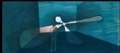
《月夜見の幻灯》イメージスケッチ図

会 期：2015年4月10日(金)～8月2日(日) 会 場：早稲田大学 演劇博物館 展示室2、展示室3