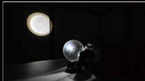
《月夜見の幻灯》栗原寿行