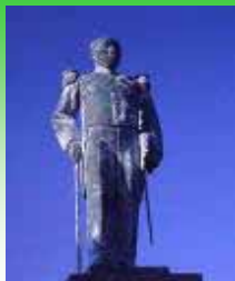
大隈重信侯銅像 於)大隈重信侯旧宅