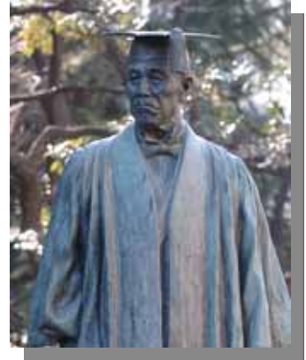
大隈重信侯銅像 於)早稲田大学