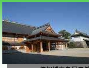
佐賀城本丸歴史館