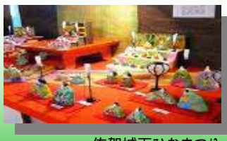
佐賀城下ひなまつり